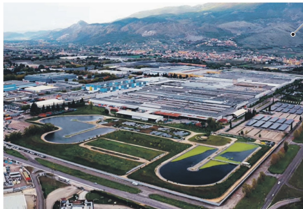
Lo stabilimento di Cassino